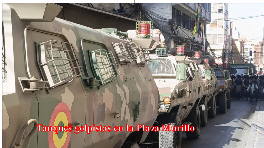
Tanques golpistas en la Plaza Murillo

ron a una inmediata movilización en todo el territorio nacional. La Central Obrera Boliviana (COB) siguiendo al líder del MAS llamó al paro por tiempo indeterminado. El intento golpista terminó en revuelta, en una escaramuza que terminó con veinte detenidos, dieciocho de los cuales son militares. Mas allá de ello, se generó una grieta aún mayor en el oficialismo, porque Morales entiendo que todo fue una puesta en escena para fortalecer la imagen del Presidente Arce. El Presidente de Brasil, Luiz Inacio Lula Da Silva intenta mediar entre ambos dirigentes para evitar que en esa grieta se meta nuevamente la ultraderecha desestabilizando la región como cuando dieron el Golpe de Estado de 2019.