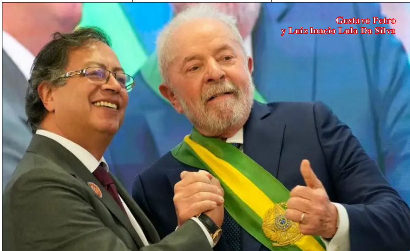
Gustavo Petro y Luiz Inacio Lula Da Silva

manentemente emite en medios periodísticos de ultraderecha. Como el desequilibrado mandatario rioplatense no solo no se retracta sino que sigue diciendo que el brasileño es un corrupto desde el Palacio del Planalto e Itamaratí aprovechan que Colombia está en democracia desde la presidencia de Gustavo Petro, se armaría una nueva alianza con Bogotá, que además le daría salida al Pacífico.