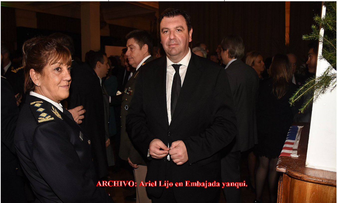
Ariel Lijo en Embajada yanqui.

Además, Lijo y los uniformados se llevaron material administrativo de tres merenderos, un Bachillerato para adultos y una Unidad Básica. La localización geográfica de los allanamientos fueron en la Ciudad de Buenos Aires (CABA), en la Provincia de Buenos Aires (Tristán Suárez, Budge y San Justo).