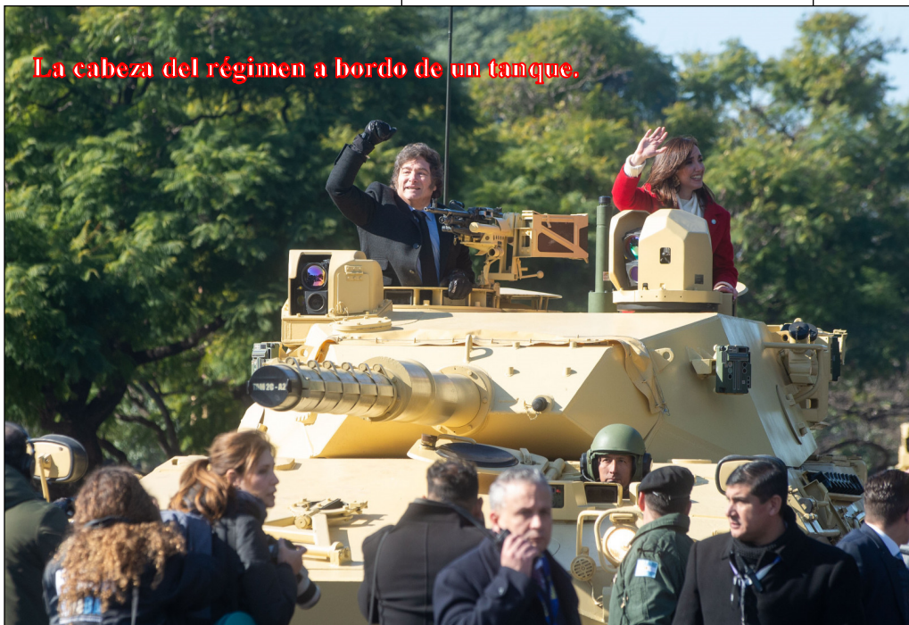
La cabeza del régimen a bordo de un tanque.

El mismo régimen que le niega los alimentos a los comedores populares e impulsa la desocupación a cifras de dos dígitos, gastó una cifra sideral e innecesaria en lo que fue una reivindicación a la violencia armada a la que es tan propensa la ultraderecha. La Vicepresidenta Villarruel está histórica y políticamente ligada a las dictaduras militares empresarias a las que reivindica con el genocida Jorge Videla a la cabeza.