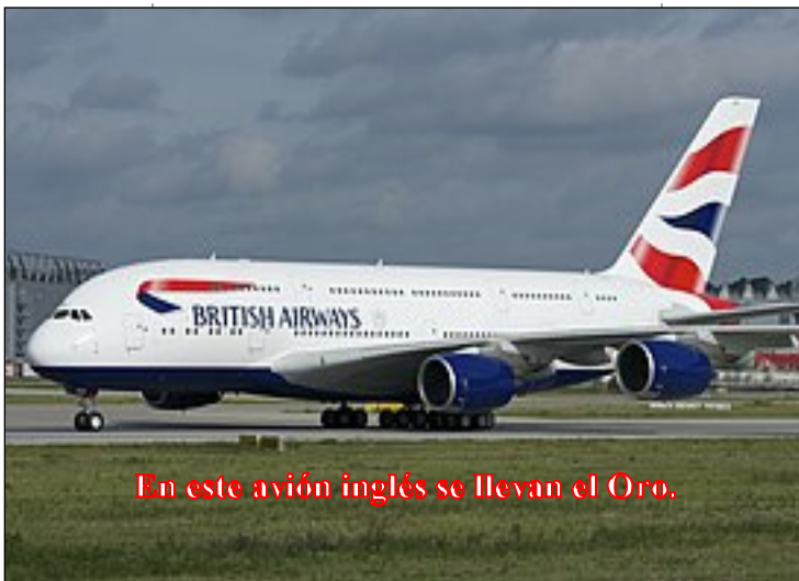
En este avión inglés se llevan el Oro.

En dos envíos, realizados el 7 de junio y el 28 del mismo mes, el metálico que se utiliza como reserva se habría enajenado y llevado a Londres. Los ingleses tienen fama de piratas ya que por ejemplo lo que tenía depositado la hermana República Bolivariana de Venezuela se lo dieron al terrorista es-