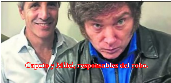
Caputo y Milei, responsables del robo.

tadounidense Juan Guaidó en lugar de (como co-