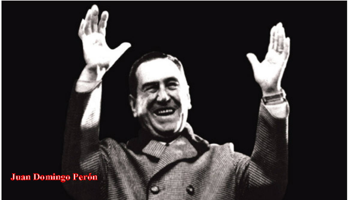
Juan Domingo Perón

La dictadura de Pedro Eugenio Aramburu e Isaac Rojas del Ejército y la Armada sumió a la Argentina en un momento de oscuridad donde hasta las sucesiones dictatoriales de 1973 se encargaron a destruir a la industria y los avances que en solo diez años había logrado el