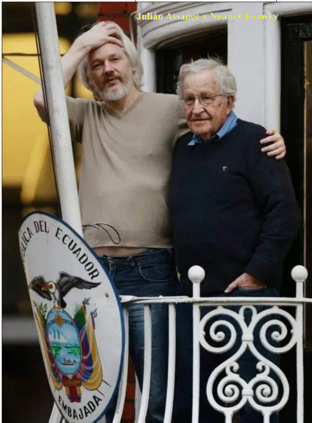
Julian Assange y Noam Chomsky

El 20 de agosto de 2020, dos mujeres que luego se supo que trabajaban para los servicios de inteligencia de países de la Organización del Tratado del Atlántico Nor-