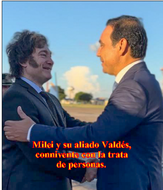
Milei y su aliado Valdés, connivente con la trata de personas.