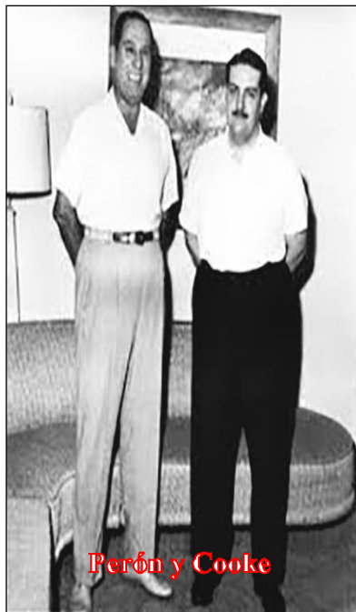
Perón y Cooke

En un enroque legal por trampas electorales puestas por la dictadura saliente, Héctor J. Cámpora que había ganado