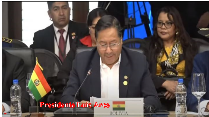
Presidente Luis Arce

Por Raúl Asambloc. - Un grupo de militares insurrectos tomó la Casa del Pueblo (sede del Gobierno Nacional) en el Estado Plurinacional de Bolivia en un intento de Golpe de Estado. Al frente se encontraba el General Juan José Zúñiga que había sido desplazado de su cargo en la víspera. Desde las 15 hs del día 26 de junio cuatro tanquetas tomaron la Plaza Murillo que es donde se encuentran no solo el Palacio Presidencial sino también la Legislatura. Con un blindado forzaron la entrada del principal edificio e ingresó el golpista. Al cruce le salió el Presidente Luis Arce que lo increpó a la vista de los periodistas antes de que fuera detenido. En medio del desconcierto que intenta dejar sin democracia a Bolivia, el