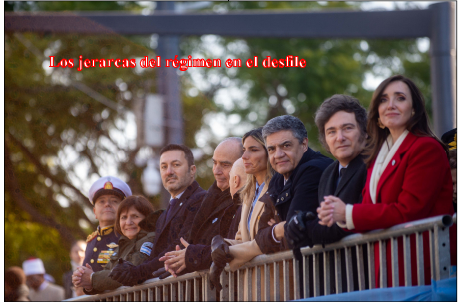
Los jefes del régimen en el desfile

En medio de la peor crisis socioeconómica autogenerada por un gobierno desde 1983, el régimen nazimacrista de Javier Milei y Victoria Villarruel realizaron en la Ciudad de Buenos Aires un desfile militar con 8.750 efectivos que al país le costó $ 15.000 millones de pesos, (equivalente a u$s 13,2 millones de dólares). En lo que terminó siendo una reivindicación carapintada (con tres banderas alusivas) desfilaron tropas, camiones y tanques de guerra. Los integrantes del Poder Ejecutivo,